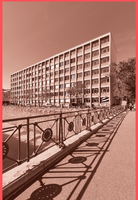
Schwanzer-Trakt am Oskar-Kokoschka-Platz