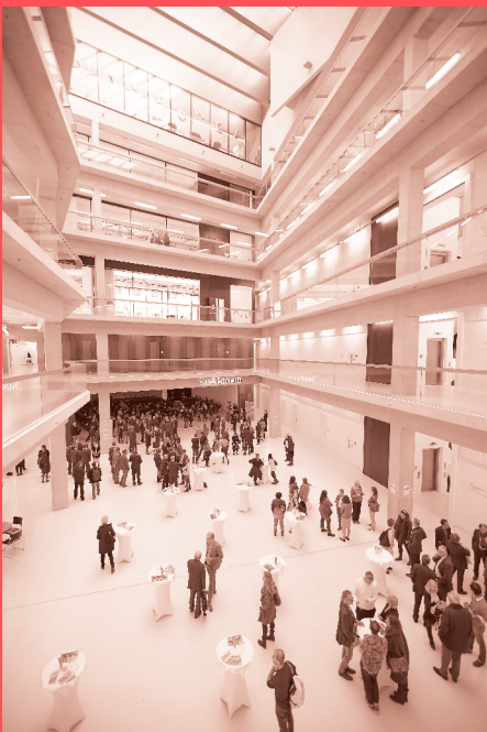
Expositur VZA7 in der Vorderen Zollamtsstraße