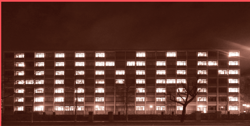
Licht-Kunst-Signal Human 2019, Installationsansicht der Interaktionsreihe HUMAN © Universität für angewandte Kunst Wien