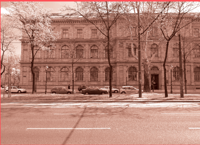
Ferstel-Trakt am Stubenring / Oskar-Kokoschka-Platz © Birgit und Peter Kainz